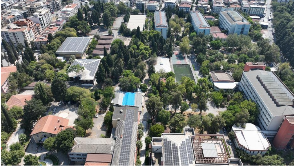
Şekil 4. Dokuzçesmeler Yerleşkesi GES Projesi Çatı Kurulumları

Tablo 13, Eğitim Fakültesi Yerleşkesi GES Projesinin teknik detaylarını vermektedir. Kurulu gücü 760 kWe olan ve otopark ile çatı üstü kurulumlarını içeren bu etabın kurulumları tamamlanmış ve 19.12.2022 tarihinde kabulü yapılmış olup, enerji üretimi başlamıştır. Şekil 5, Buca Eğitim Fakültesi Yerleşkesindeki GES kurulumlarını göstermektedir.