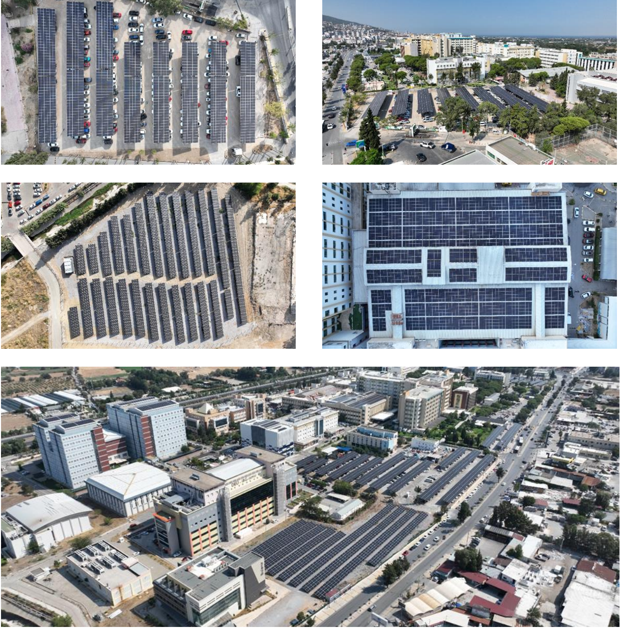
Şekil 2. İnciraltı 1. Ve 2. Etap GES Projesi Çatı-Arazi-Otopark Kurulumları

Şekil 2, İnciraltı 1. ve 2. Etap GES Projelerine ait görselleri ifade etmektedir.