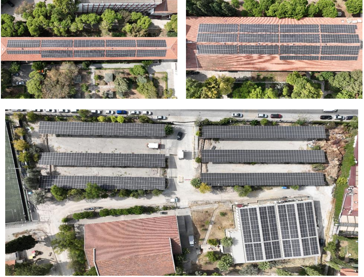
Şekil 5. Buca Eğitim Fakültesi Yerleşkesi GES Projesi Çatı ve Arazi Kurulumları

Tablo 14, Torbalı Yerleşkesi GES Projesinin teknik detaylarını vermektedir. Kurulu gücü 806 kWe olan ve çatı ve arazide kurulumu içeren Torbalı etabının kurulumları tamamlanmış ve 02.01.2023 tarihinde kabulü yapılmış olup, enerji üretimi başlamıştır. Şekil 6, Torbalı Yerleşkesindeki GES kurulumlarını göstermektedir.