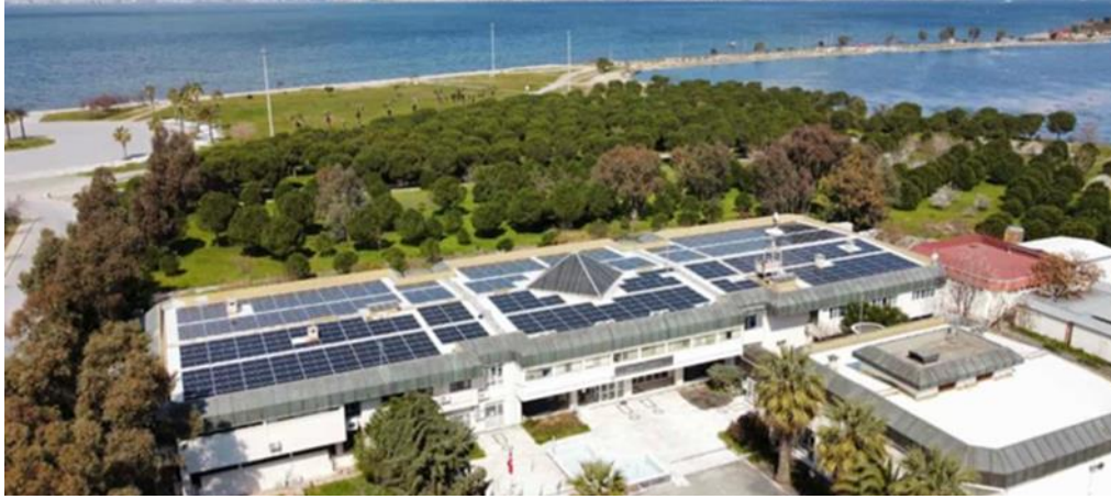
Şekil 3. Deniz Bilimleri Enstitüsü GES Projesi Çatı Kurulumu

Tablo 12, İktisadi ve İdari Bilimler Fakültesi'nin içinde olduğu Dokuzçesmeler Yerleşkesi GES Projesinin teknik detaylarını vermektedir. Kurulu gücü 950 kWe olan ve çatı üstü kurulumlarını içeren bu etabın kurulumları tamamlanmış, 04.01.2023 tarihinde kabulü yapılmış olup, enerji üretimi başlamıştır. Şekil 4, Dokuzçesmeler Yerleşkesindeki GES kurulumunu göstermektedir.