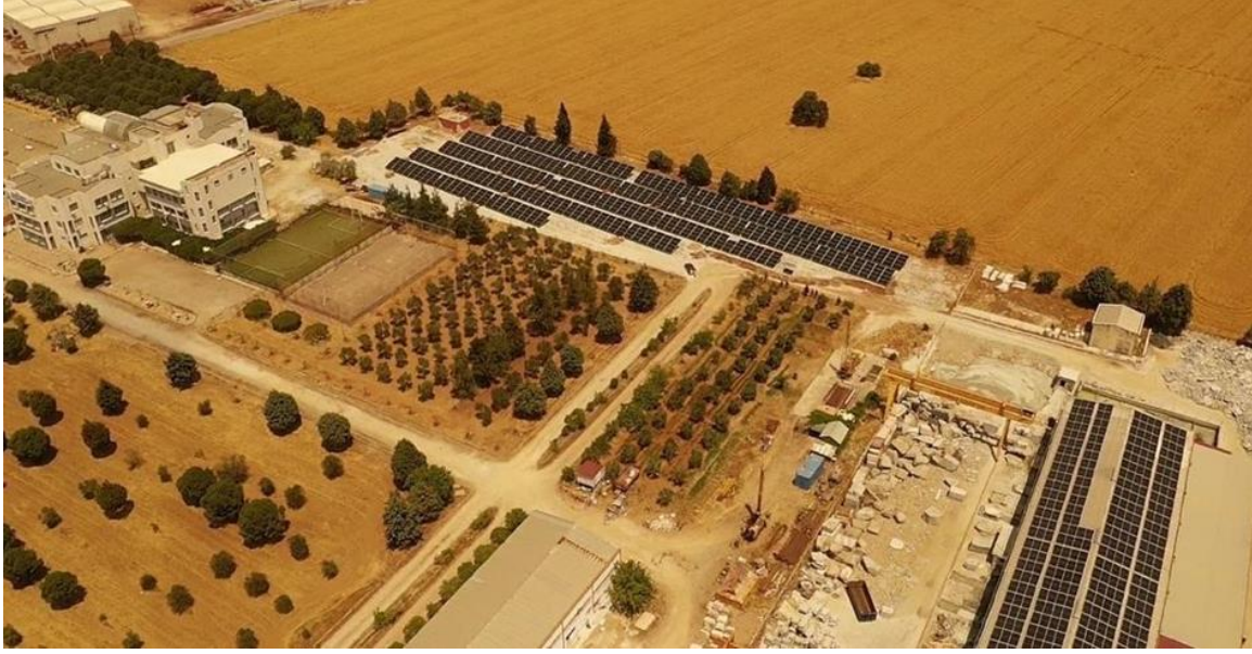
Şekil 6. Torbalı Yerleşkesi GES Projesi Çatı ve Arazi Kurulumları

Tablo 15, Tınaztepe Yerleşkesi GES Projesinin teknik detaylarını vermektedir. Kurulu gücü 4840 kWe olan ve çatı ve arazide kurulumu içeren Tınaztepe etabının kurulumları tamamlanmış ve 03.05.2023 tarihinde kabulü yapılmış olup, enerji üretimi başlamıştır. Şekil 7, Tınaztepe Yerleşkesindeki GES kurulumlarını göstermektedir.