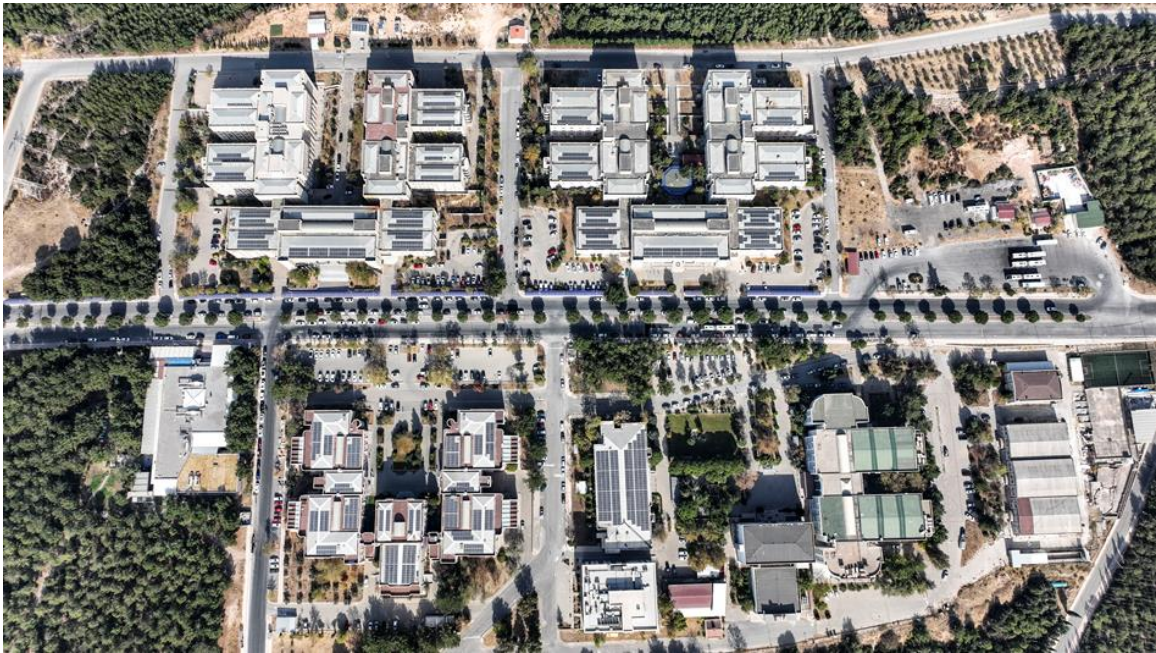
Şekil 7. Tınaztepe Yerleşkesi Çatı ve Arazi Kurulumlu GES Projesine ait Görseller